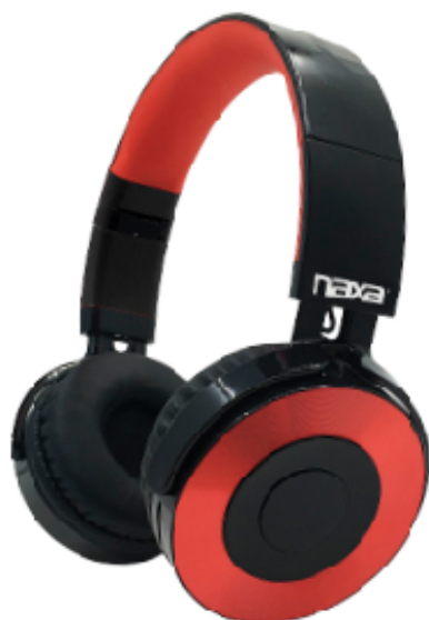
Audifonos Inalámbricos Bluetooth®